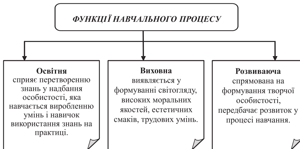
Рис. 2. Функції навчального процесу в системі якості освіти

Таким чином, навчальний процес як складова частина загального виховання всебічно розвиненої сучасної особистості повинен забезпечити виконання пізнавального завдання реалізацією трьох функцій, основними з яких є освітня, виховна і розвиваюча (рис. 2).