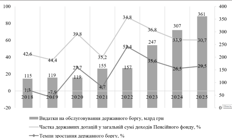
Рис. 3. Динаміка боргових індикаторів фіскального регулювання та їхній вплив на економічну безпеку України, 2018–2025 рр.