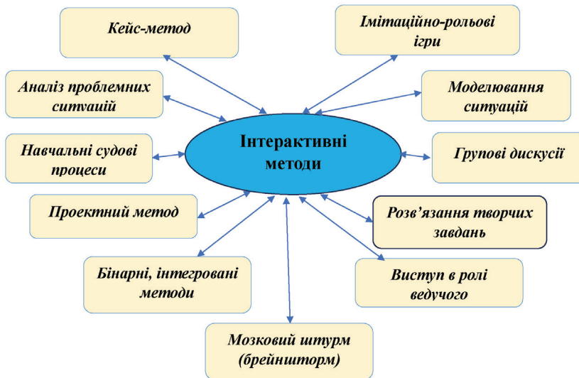
Рис.3. Інтерактивні методи навчання, впроваджені у педагогічний процес

В рамках навчального процесу використовується широкий арсенал інтерактивних методів навчання, які базуються на особистісно-діяльнісному підході: кейс методи, аналіз проблемних ситуацій, розв'язання творчих задач, ділові ігри, навчальні судові процеси, моделювання ситуацій, проектування тощо (рис.3). Підбір та використання інтерактивних методів залежить від змісту, мети та завдань кожної конкретної теми. Перш за все це організація групової роботи (робота в малих групах) у різних формах: групова взаємодія виступає як фактор розвитку індивідуально-особистісної активності кожного члена групи та команди в цілому. Така групова динаміка являє собою сукупність соціально-психологічних процесів в групі, прийняття рішень всіма членами команди і, водночас забезпечує вплив один на одного. В процесі групової взаємодії ефективним є метод мозкового штурму (брейншторм) з метою генерування ідей для конструктивного вирішення проблеми, сприяє творчій активності учасників.