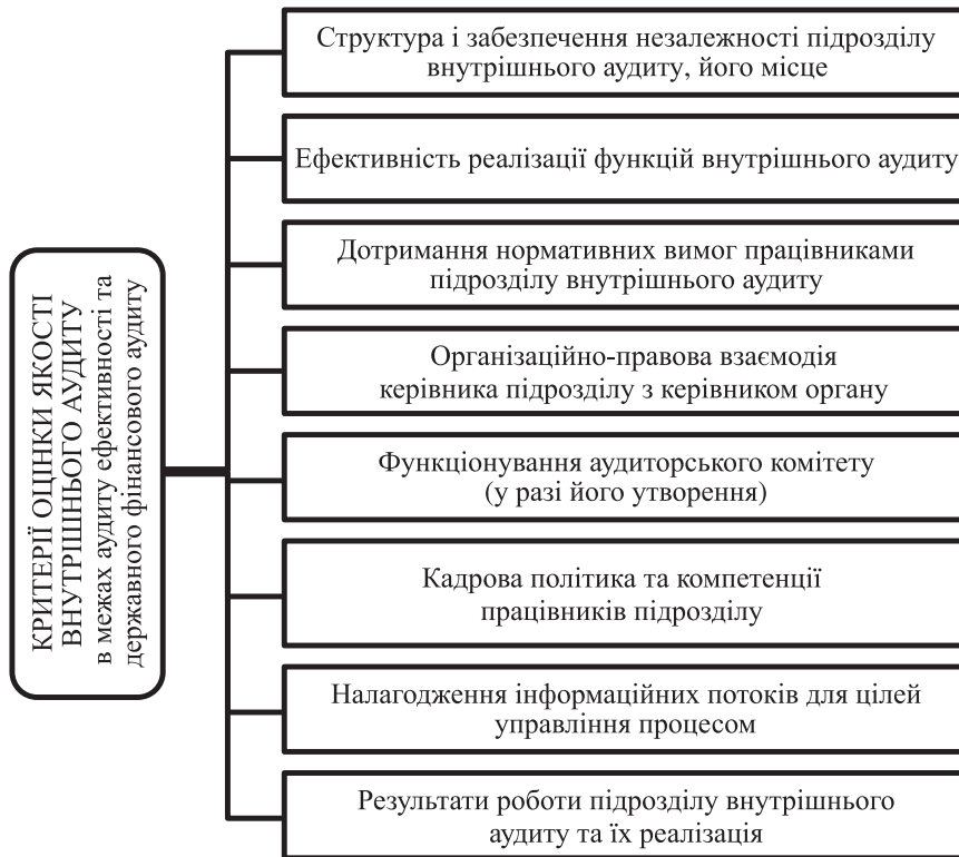
Рис. 2. Критерії оцінки якості внутрішнього аудиту для потреб зовнішніх контролюючих органів

внутрішнього аудиту безпосередньо керівнику установи. Крім того, внутрішня документація передбачає заходи щодо уникнення можливості втручання третіх осіб у діяльність підрозділу та унеможливлення конфлікту інтересів при виконанні покладених на підрозділ завдань.