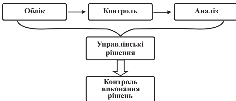
Рис. 1. Контроль як складова процесу господарювання

Доречно зазначити, що метою внутрішньогосподарського контролю є забезпечення достовірності оперативної інформації про діяльність підприємства для прийняття ефективних управлінських рішень, і це можливо лише за раціональної його організації. Внутрішньогосподарський контроль супроводжує весь процес господарювання і є однією із базових складових, що забезпечують цей процес (рис. 1.).