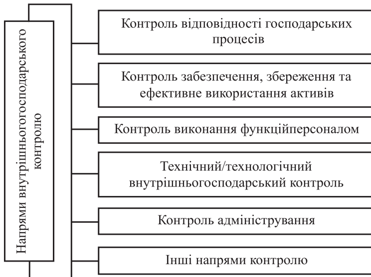
Рис. 2. Напрями внутрішньогосподарського контролю

Класифікуючи внутрішньогосподарський контроль за різними ознаками, можемо окреслити важливі його напрями (рис. 2).