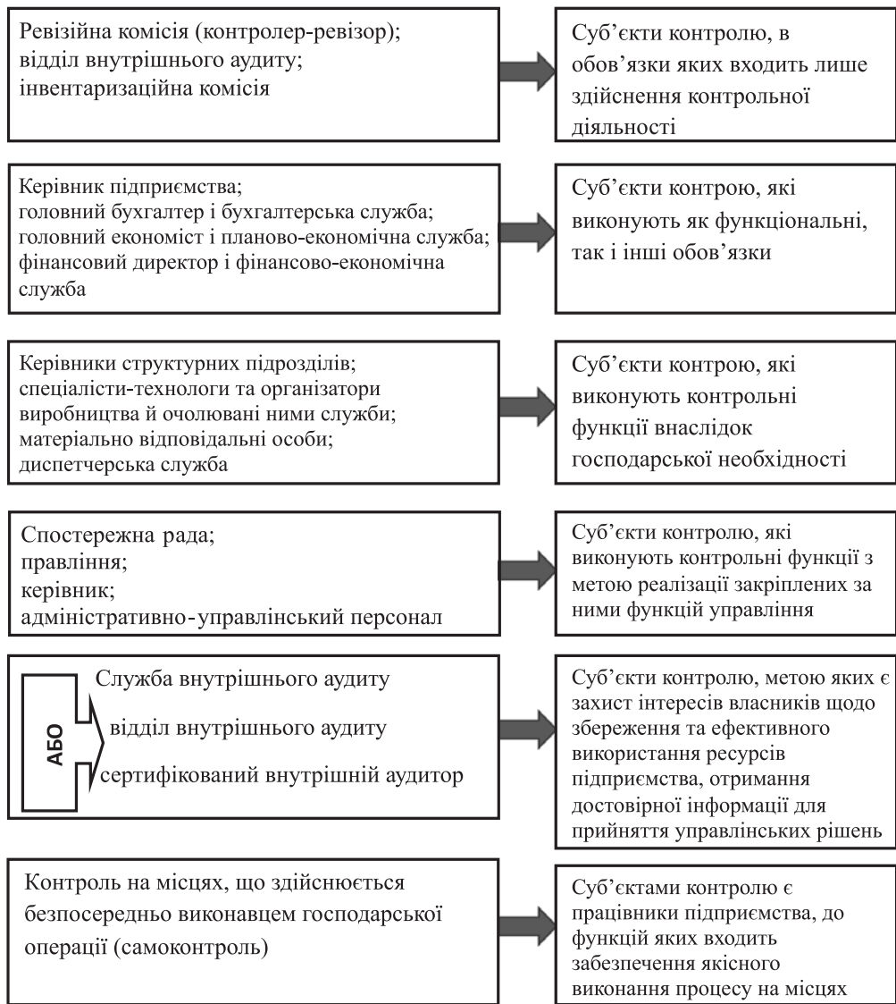
Рис. 3. Класифікація суб'єктів внутрішньогосподарського контролю підприємства