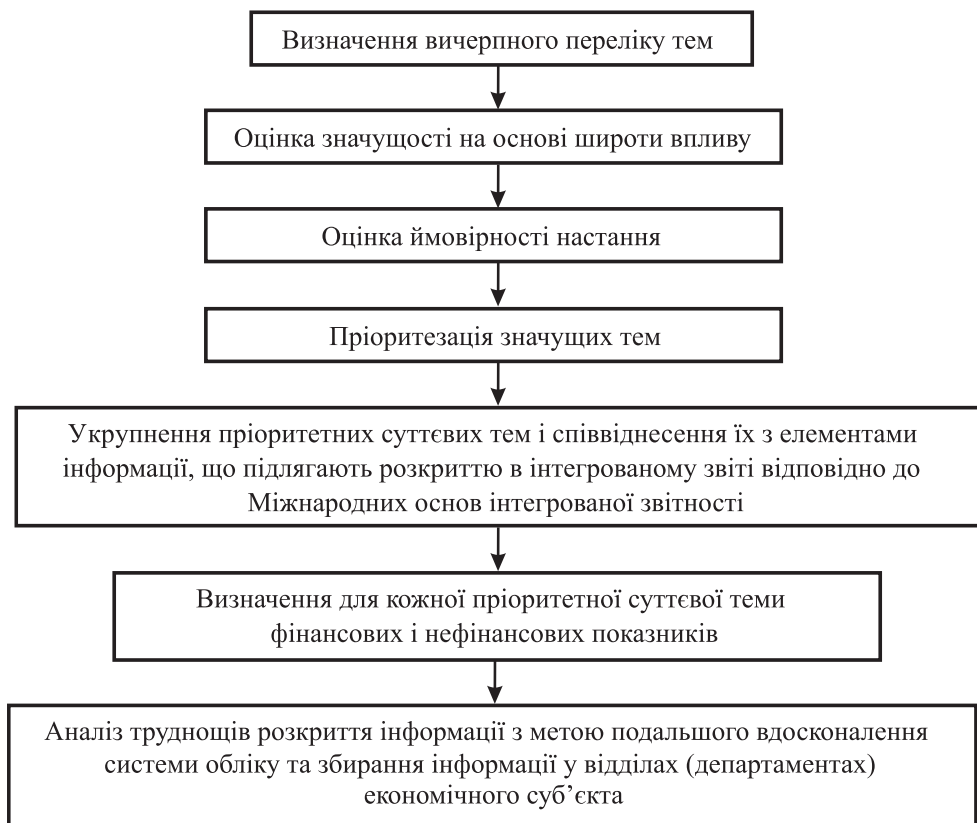
Рис. 2. Алгоритм визначення суттєвості для цілей інтегрованої звітності

Н. Малиновська наводить алгоритм визначення суттєвості для цілей інтегрованої звітності (рис. 2).