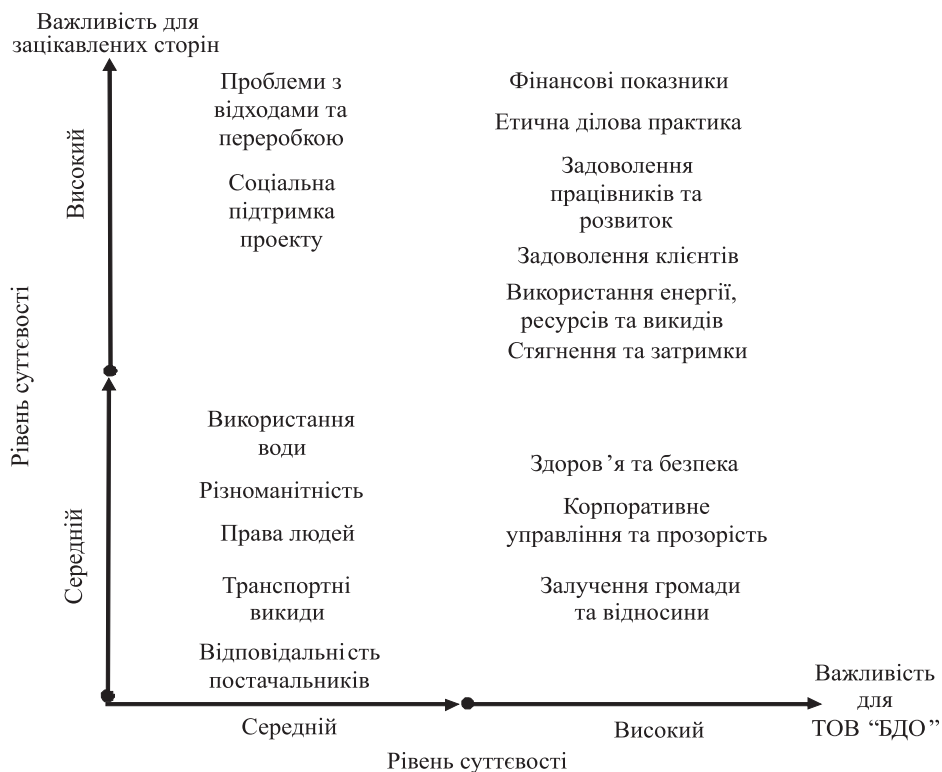
Рис. 3. Карта суттєвості в інтегрованій звітності ТОВ “БДО”